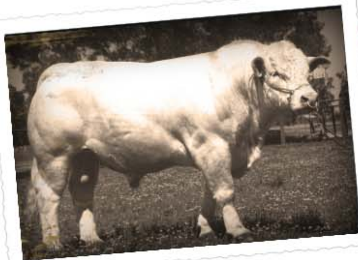
om na te kyk.

Die meeste van julle is seker al bewus van die nuwe module in BeefPro, naamlik Beef Cattle Trader (Toevoegings > BeefCattleTrader).